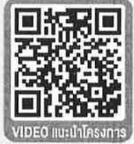
VIDEO แนะนำโครงการ

(Infrastructure Transparency Initiative: CoST)