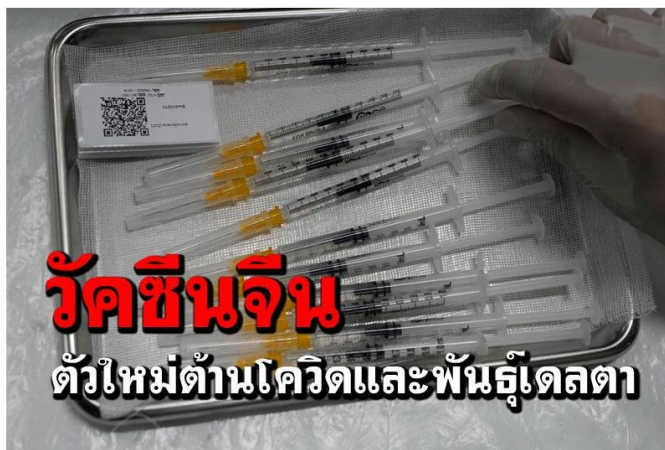
ผลทดลอง'วัคซีนจีน'ตัวใหม่ พบประสิทธิภาพต้านโควิด-19และเดลตา

เว็บไซต์ : https://www.naewna.com/inter/604861