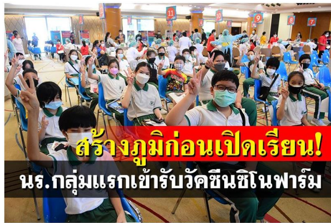
เริ่มแล้ว! นร.กลุ่มแรกเข้ารับวัคซีนซิโนฟาร์ม สร้างภูมิก่อนเปิดเรียน (ประมวลภาพ)

เว็บไซต์ : https://www.naewna.com/local/603295