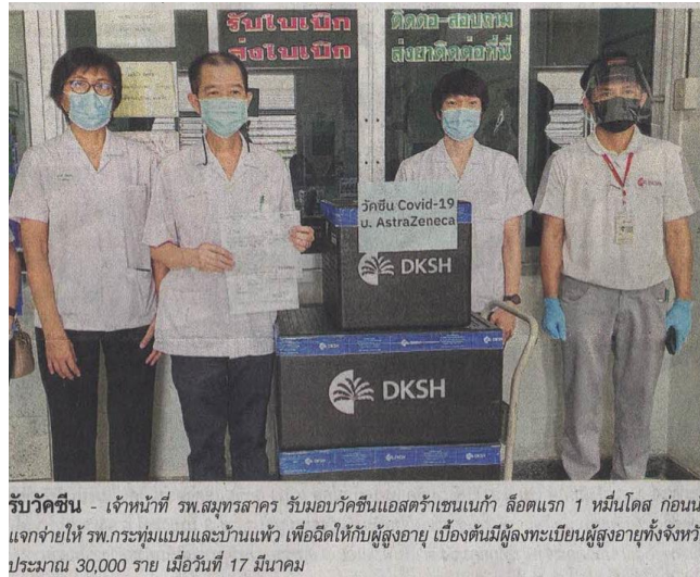
รับวัคซีน - เจ้าหน้าที่ รพ.สมุทรสาคร รับมอบวัคซีนแอสตราเซนเนกา ล็อตแรก 1 หมินโดส ก่อนนำแจกจ่ายให้ รพ.กระทู้มแบนและบ้านแพ้ว เพื่อฉีดให้กับผู้สูงอายุ เบื้องต้นมีผู้ลงทะเบียนผู้สูงอายุทั้งจังหวัดประมาณ 30,000 ราย เมื่อวันที่ 17 มีนาคม

ข่าวประจำวันพฤหัสบดีที่ ๑๘ มีนาคม ๒๕๖๔ หน้าที่ ๑๖