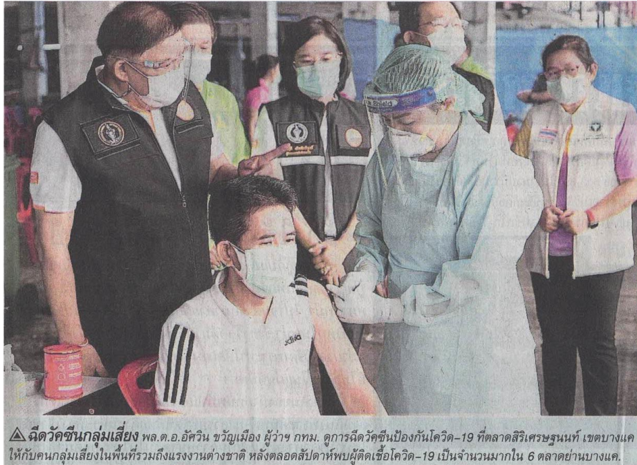
▲ฉีดวัคซีนกลุ่มเสี่ยง พล.ต.อ.อัศวิน ขวัญเมือง ผู้ว่าฯ กทม. ดูการฉีดวัคซีนป้องกันโควิด-19 ที่ตลาดสิริเศรษฐนันท์ เขตบางแค ให้กับคนกลุ่มเสี่ยงในพื้นที่รวมถึงแรงงานต่างชาติ หลังตลอดสัปดาห์พบผู้ติดเชื้อโควิด-19 เป็นจำนวนมากใน 6 ตลาดย่านบางแค.

ข่าวประจำวันพฤหัสบดีที่ ๑๘ มีนาคม ๒๕๖๔ หน้าที่ ๑