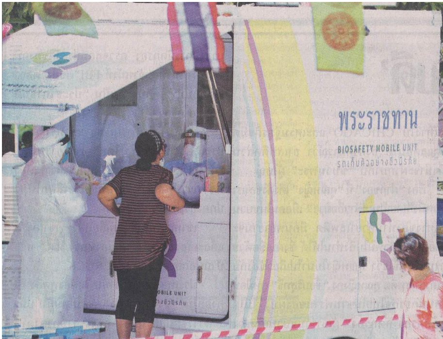
←.บริการประชาชน : สำนักงานสาธารณสุข อ.สัคดิ์หีบ นำรถพระราชทานตรวจเชื้อชีวโมเลกุล พระราชทานออกให้บริการตรวจหาเชื้อไวรัสโควิด-19 เจริญราษฎร์ฟรีไม่มีค่าใช้จ่าย โดยตั้งเป้าตรวจคัดกรองวันละ 300 ราย ที่วัดช่องแสมสาร ต.แสมสาร อ.สัคดิ์หีบ จ.ชลบุรี

ข่าวประจำวันศุกร์ที่ ๑๔ พฤษภาคม ๒๕๖๔ หน้าที่ ๑