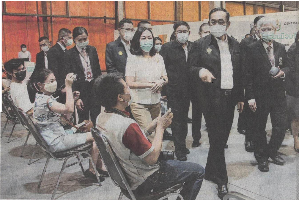
เยี่ยมศูนย์ พล.อ.ประยุทธ์ จันทร์- โอชา นายกฯ ไปตรวจเยี่ยม สถานที่ฉีดวัคซีนกันโค- วิด-19 นอกโรงพยาบาลที่ กทม.ร่วมกับสภาหอการค้า และโรงพยาบาล จัดขึ้นที่ ห้างสรรพสินค้าเซ็นทรัล ลาดพร้าว และทดลองให้ บริการวันแรก เมื่อ 12 พ.ค.

ข่าวประจำวันพฤหัสบดีที่ ๑๓ พฤษภาคม ๒๕๖๔ หน้าที่ ๑