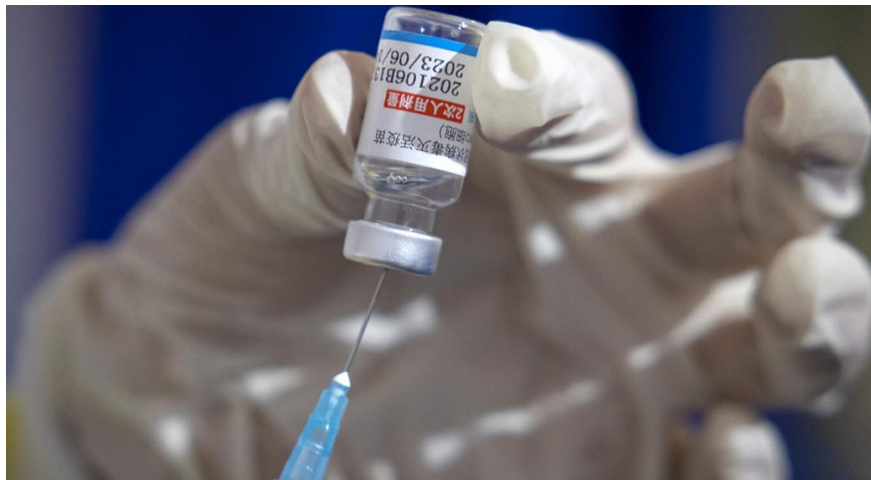
ซิโนฟาร์มขอฉีดเด็ก 3 ขวบ ยืน อย.อนุเมตติ “อุดม” ซี 7 ล้านคน มีติดเชื้อแฝง

เว็บไซต์ : https://www.thairath.co.th/news/local/2188856