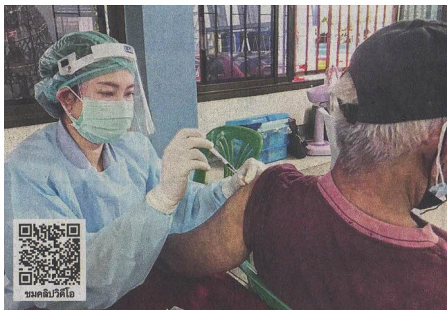
เร่งฉีด - กรุงเทพมหานครระดมทีมบุคลากรทางการแพทย์ลงพื้นที่ตรงจุดคัดกรองหาผู้ติดเชื้อไวรัสโคโรนา-19 ในชุมชนต่างๆ อย่างต่อเนื่อง โดยตั้งจุดคัดกรองเชิงรุกกลุ่มเสี่ยงสูงและเร่งฉีดวัคซีนแก่ชาวชุมชนที่โรงเรียนวัดคลองเตย เขตคลองเตย กรุงเทพฯ เมื่อวันที่ 6 พฤษภาคม

ข่าวประจำวันศุกร์ที่ ๗ พฤษภาคม ๒๕๖๔ หน้าที่ ๑