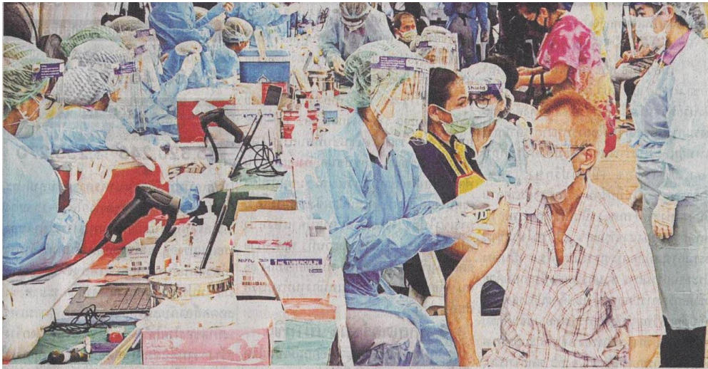
▲ ฉีดวัคซีน...แพทย์-สาธารณสุข กทม. ปฏิบัติการเชิงรุกเร่งฉีดวัคซีนที่โรงเรียนวัดคลองเตยและห้างสรรพสินค้าเอสไอเอส สาขาพระราม 4 แขวง-เขตคลองเตย กรุงเทพมหานคร เพื่อควบคุมและป้องกันการแพร่ระบาดของเชื้อไวรัสโควิด-19 ท่ามกลางสถานการณ์วิกฤติอย่างต่อเนื่อง

ข่าวประจำวันศุกร์ที่ ๗ พฤษภาคม ๒๕๖๔ หน้าที่ ๑