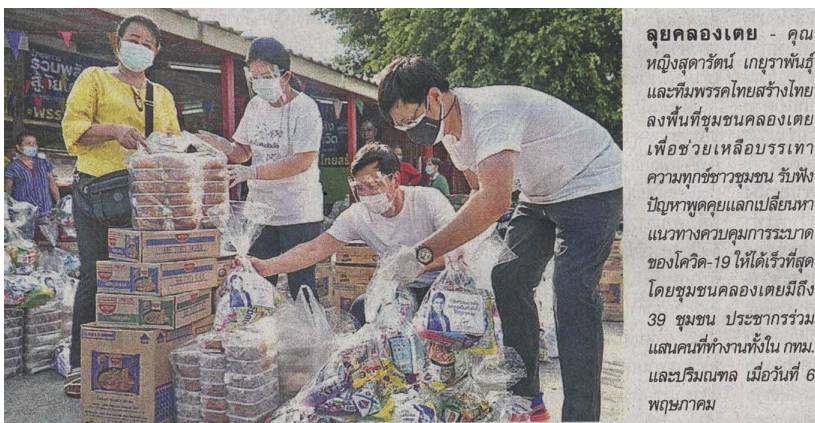
ลุยคลองเตย - คุณหญิงสุดารัตน์ เกยุราพันธุ์ และทีมพรรคไทยสร้างไทย ลงพื้นที่ชุมชนคลองเตย เพื่อช่วยเหลือบรรเทาความทุกข์ชาวชุมชน รับฟังปัญหาพูดคุยแลกเปลี่ยนหาแนวทางควบคุมการระบาดของโควิด-19 ให้ได้เร็วที่สุด โดยชุมชนคลองเตยมีถึง 39 ชุมชน ประชากรร่วมแสนคนที่ทำงานทั้งใน กทม. และปริมณฑล เมื่อวันที่ 6 พฤษภาคม

ข่าวประจำวันศุกร์ที่ ๗ พฤษภาคม ๒๕๖๔ หน้าที่ ๑