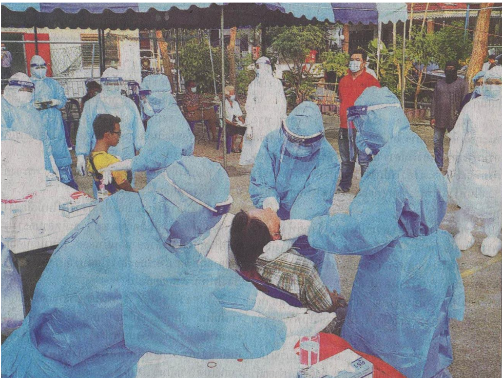
◀...ตรวจรอบ 2 : ทีมแพทย์จากโรงพยาบาลสมุทรปราการ และเจ้าหน้าที่สาธารณสุขอำเภอเมืองสมุทรปราการ ลงพื้นที่ตรวจสอบหาผู้ติดเชื้อโควิด-19 ภายในหมู่บ้านที่องท่า 10 ซอยมังกรนาคคี ต.แพรกษา อ.เมือง จ.สมุทรปราการ รอบที่ 2 หลังจากที่ยังคงพบผู้ติดเชื้อในหมู่บ้านจำนวน 9 ราย

ข่าวประจำวันศุกร์ที่ ๗ พฤษภาคม ๒๕๖๔ หน้าที่ ๑