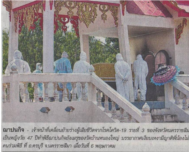
ฌาปนกิจ - เจ้าหน้าที่เคลื่อนย้ายร่างผู้เสียชีวิตจากโรคโควิด-19 รายที่ 3 ของจังหวัดนครราชสีมา เป็นหญิงวัย 47 ปีทำพิธีฌาปนกิจยังเมรุของวัดบ้านหนองใหญ่ บรรยากาศเงียบเหงามีญาติพี่น้องไม่กี่คนร่วมพิธี ที่ อ.ครบุรี จ.นครราชสีมา เมื่อวันที่ 6 พฤษภาคม

ข่าวประจำวันศุกร์ที่ ๗ พฤษภาคม ๒๕๖๔ หน้าที่ ๑๖