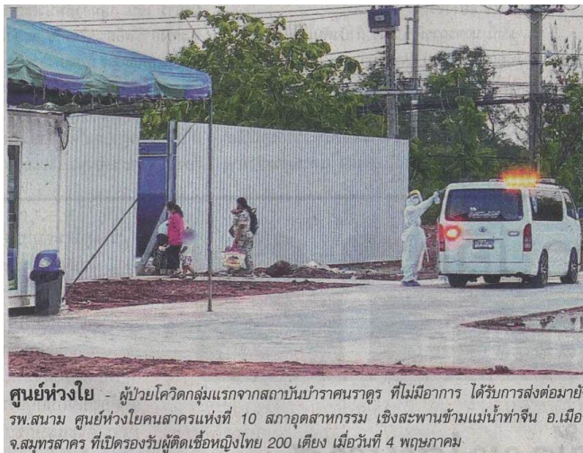
ศูนย์ห่วงใย - ผู้ป่วยโควิดกลุ่มแรกจากสถานบันเทิงบ่อนราตรี ที่ไม่มีอาการ ได้รับการส่งต่อมายัง รพ.สนาม ศูนย์ห่วงใยคนสาครแห่งที่ 10 สภากงตง อ.เมือง จ.สมุทรสาคร ที่เปิดรองรับผู้ติดเชื้อหญิงไทย 200 เตียง เมื่อวันที่ 4 พฤษภาคม

ข่าวประจำวันพุธที่ ๕ พฤษภาคม ๒๕๖๔ หน้าที่ ๑