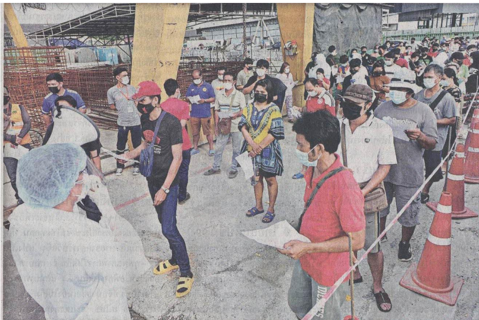
▲ ตรวจคัดกรอง... เจ้าหน้าที่สาธารณสุขจังหวัดสมุทรปราการ ลงพื้นที่ตรวจแรงงานต่างด้าวในแคมป์พักคนงาน ของบริษัทรับเหมาก่อสร้าง ในพื้นที่หมู่ 6 ตำบลโคกขุดสหกรณ์บางปู ต.แพรกษา หลังมีคนติดเชื้อมัลติplikon พวกเขาขยายเป็นคลัสเตอร์ใหม่ของสมุทรปราการ

ข่าวประจำวันพุธที่ ๕ พฤษภาคม ๒๕๖๔ หน้าที่ ๑