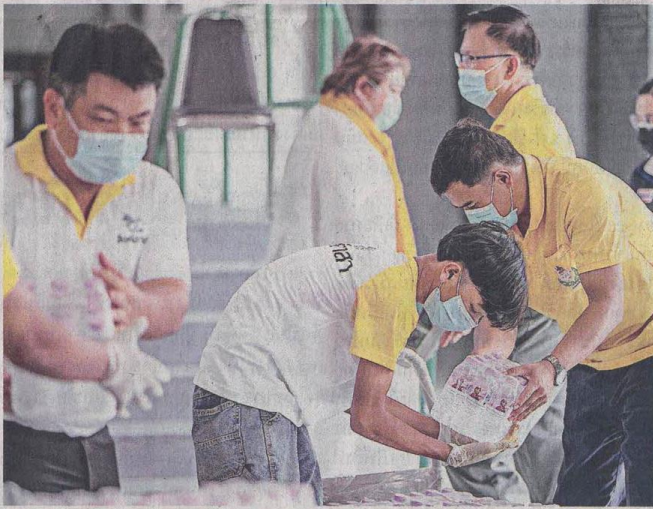
☒ ผู้ช่วยโควิด...สิงห์อาสาโดยมูลนิธิพระยาภิรมย์ภักดีและบริษัทบุญรอด บริวเวอรี่ จำกัด นำอาหารและน้ำดื่มไปสนับสนุนการทำงานของแพทย์และเจ้าหน้าที่ ที่อาคารนิมิตร์ สยามกีฬาแห่งชาติ

นอกจากนี้จะให้สถาบันการเงินเฉพาะกิจของรัฐ เช่น ธนาคารออมสิน ธนาคารเพื่อการเกษตรและสหกรณ์การเกษตร ปล่อยกู้ฉุกเฉินให้ชาวบ้านวงเงินอีกกว่าหมื่นล้านบาท และขยายเวลาพักหนี้ให้ผู้เดือดร้อน รวมถึงยังมีมาตรการลดค่าใช้จ่าย อาทิ การลดค่าน้ำ ค่า