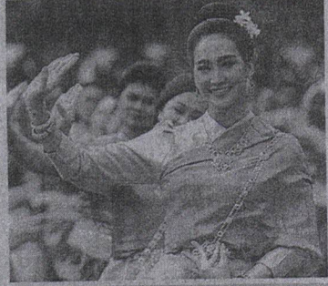
ดาราสาวและสาวงามเข้าร่วมร่วมวงสรวงจวงวณดินตาอินไชย้เข้าร่วมงาน.