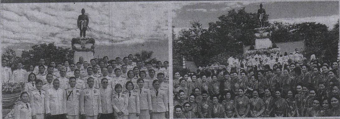
นายถาณู เข้มศรี ผวจ.พระนครศรีอยุธยา นำหัวหน้าส่วนราชการ สวด ทวาร สารวง ข้าราชการ และประชาชน ร่วมประกอบพิธีบางสร้างสักการะสิ่งศักดิ์สิทธิ์คู่มือเมือง และ สมเด็จพระรามาธิบดีที่ 1 (พระเจ้าอู่ทอง) ปฐมกษัตริย์แห่งกรุงศรีอยุธยา เมื่อวันที่ 8 ธ.ค.2563.