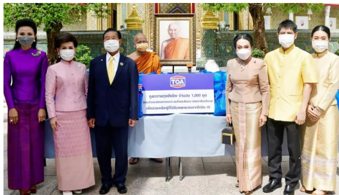
มูลนิธิพระอริยวงศาคตญาณ สมเด็จพระสังฆราช สกลมหาสังฆปริณายก เพื่อไปช่วยเหลือประชาชนได้รับผลกระทบจากโควิด ที่วัดราชพิพิธนันทมาภิบาลวันก่อน