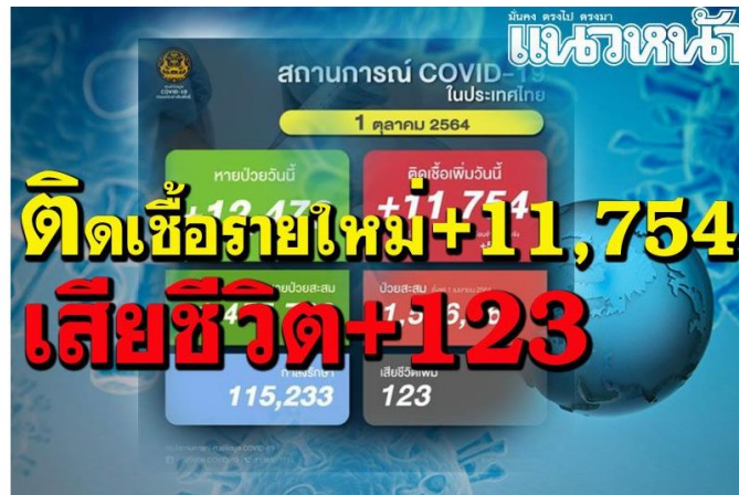
โควิดไทยติดเชื้อรายใหม่หลักหมื่น 11,754 ราย เสียชีวิต 123 ราย

เว็บไซต์ : https://www.naewna.com/local/605853