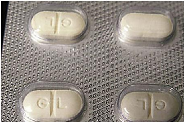
ภาพประกอบจากอินเทอร์เน็ต

อย.ย้ำห้ามผลิต ขาย นำเข้า ส่งออก "อัลปราโซแลม" หรือ ยาเสียสาว ตั้งแต่ 17 มิ.ย.นี้ เว้น สธ.และผู้ได้รับมอบหมาย กำชับร้านขายยาส่งคืนทั้งหมด ด้านผู้ประกอบการวิชาชีพเวชกรรม ต้องขอรับใบอนุญาตให้มีไว้ในครอบครองฯ