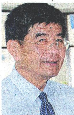
นพ.ณรงค์ สหเมธาพัฒน์

นพ.ณรงค์ สหเมธาพัฒน์ ปลัดกระทรวงสาธารณสุข (สธ.) เปิดเผยว่า จากการสำรวจปัญหาสาธารณสุขทั่วประเทศ พบว่า พื้นที่จังหวัดชายแดนภาคใต้มีปัญหาสุขภาพช่องปากสูงสุด โดยผลสำรวจของกรมอนามัยในปี 2554 พบว่า เด็กไทยเฉลี่ยร้อยละ 50 เป็นโรคฟันผุ สูงสุดในพื้นที่ภาคใต้ร้อยละ 65 โดยเฉพาะใน