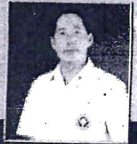
นายแพทย์ธเรศ กรัษนัยรวิวงศ์ อธิบดีกรมควบคุมโรค

วันที่ 8 มีนาคม 2566 เวลา 09.30 - 17.00 น.