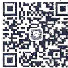
QR Code เข้าร่วมกลุ่มไลน์