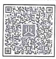
เอกสารสิ่งที่ส่งมาด้วย ๒