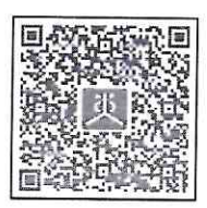
เอกสารสิ่งที่ส่งมาด้วย ๑