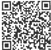
Rum Wang Rong Songkran (Sunblossom Rong - English version)

๒. คิวอาร์โค้ดเพลงสงกรานต์ฉบับภาษาต่างประเทศ