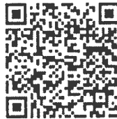
Songkran - Chinese version