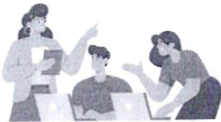
หลักสูตร Smart City กลุ่มประชาชนทั่วไป

บทเรียนพื้นฐานของ Smart City 7 หัวข้อ เช่น