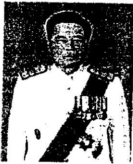
๓. นายณัฐจักร ปัทมสิงห์ ณ อยุธยา อัยการอาวุโส สำนักงานอัยการสูงสุด