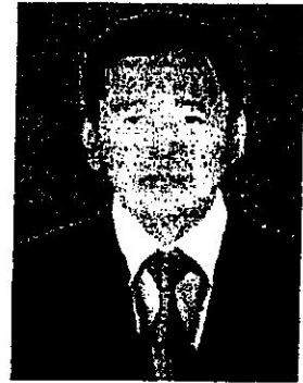
๘. พลโท สุรพงศ์ เปรมบัญญัติ อดีตหัวหน้าสำนักตุลาการทหาร และตุลาการพระธรรมนูญหัวหน้าศาลทหารสูงสุด