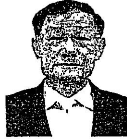
๖. พลเรือเอก ประสาน สุขเกษม อดีตรองผู้บัญชาการทหารสูงสุด